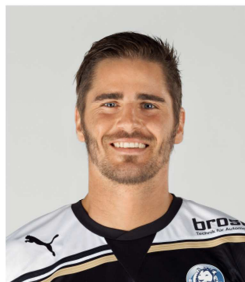
Falsch, da Aufnahme zu nah und Hüfte und Arme nicht sichtbar