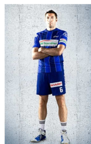
Falsch, da Arme verschränkt und Ausschnitt zu groß