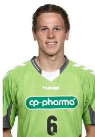
Falsch, da Arme abgeschnitten